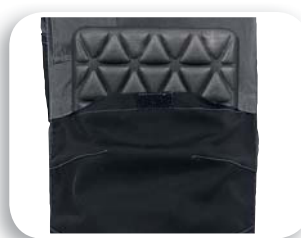
Hueco para rodilleras M5SAL - M5PAN - M5COM

Tela 60% algodón 40% poliéster 270 g/m 2 . Canesús : Tela 55% poliéster 32% algodón 13% elastano 310 g/m 2 .