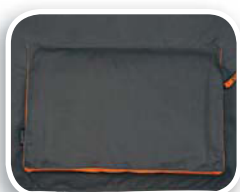
Gran bolsillo en la espalda

Tejido 65% poliéster 35% algodón 245 g/m 2 .