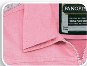
Segundo cuello desmontable por botones JULIA - ELSA - EMMA - LAETITIA