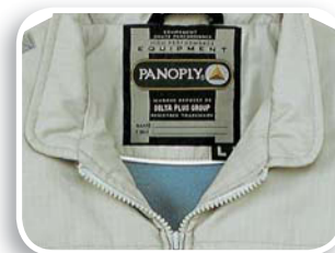
Forro lana polar

Tela Ripstop 65% poliéster 35% algodón 180 g/m 2 . Forro lana polar poliéster acolchado de algodón.