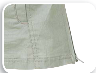
Fuelle de holgura en los lados

Tela Ripstop 65% poliéster 35% algodón 180 g/m 2 .