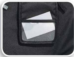
Porta pase identificador fijo incluido