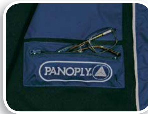
Bolsillo interior para gafas

Tejido poliamida Taslon impregnado de poliuretano. Forro cuerpo poliéster. Forro manga Tafetán poliéster acolchado de algodón.