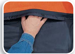
Apertura interior que permite bordado