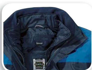
Forro desmontable Térmico 3M Thinsulate™