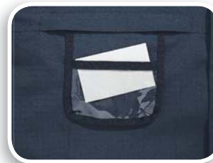
Porta pase identificador fijo incluido

Tejido poliéster Ripstop impregnado de PVC. Forro : Superior lana polar poliéster acolchado de algodón - Inferior Tafetán poliéster acolchado de algodón.