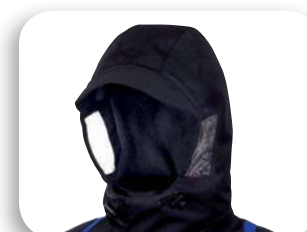
Capucha desmontable con visera lateral para la ergonomía