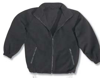
Forro desmontable utilizable solo