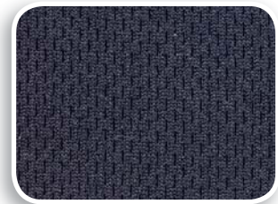
Forro malla red y muletón