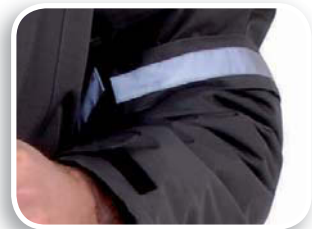
Brazalete fijo incluido en el bolsillo de la manga