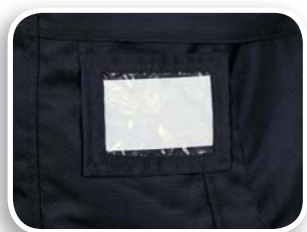
Porta pase identificador fijo incluido