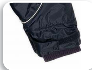
Puños tejido de punto al interior