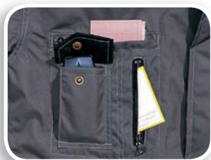
Bolsillo pecho 3 en 1 M5PAR - M5GIW

Tejido poliéster Oxford impregnado de poliuretano. Forro Tafetán poliéster acolchado de algodón.