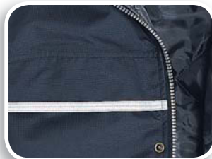
Bandas reflectantes decorativas (delante y espalda)