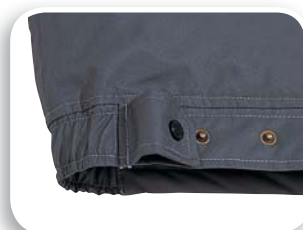
Ajuste bajo de la prenda en el dorso

Tejido poliéster Oxford impregnado de poliuretano. Forro Tafetán poliéster acolchado de algodón.