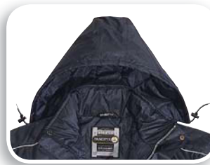
Capucha desmontable acolchado de algodón

Tejido poliéster impregnado de PVC. Forro Tafetán poliéster acolchado.