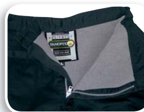
Pantalón con forro franela