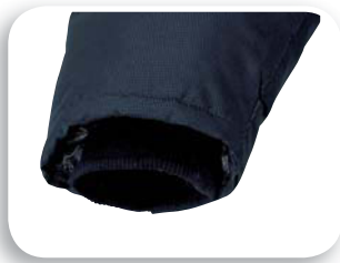
Puños tejido de punto al interior