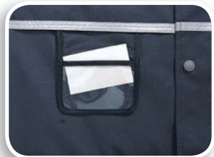
Porta pase identificador fijo incluido