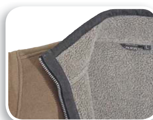
Forro tipo borreguillo