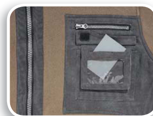
Porta pase identificador fijo incluido