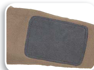
Codos con refuerzo