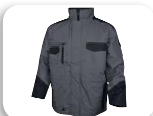
Combinado con la parka M5PAR p. 190