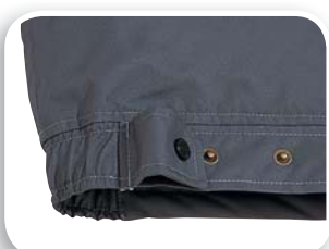
Ajuste bajo de la prenda en el dorso