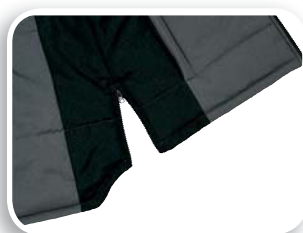
Fuelle de holgura en lados