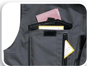
Bolsillo pecho 3 en 1

Tejido poliéster Oxford impregnado de poliuretano. Forro Tafetán poliéster acolchado.