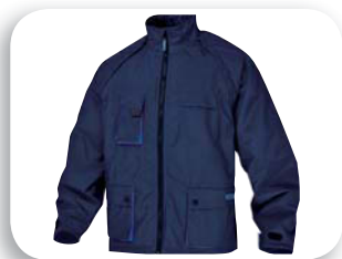
Combinado con la chaqueta NORTHWOOD p. 189