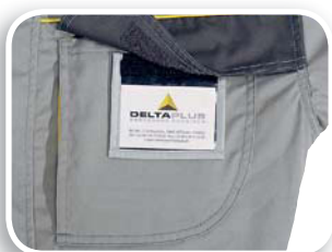
Porta pase identificador

Tejido 65% poliéster 35% algodón 235 g/m 2 . Forro Tafetán poliéster acolchado de algodón.