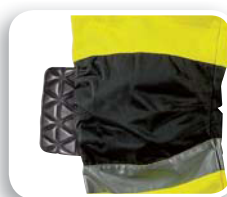
Hueco para rodilleras

Tejido 60% algodón 40% poliéster 270 g/m 2 . Bandas retroreflectantes cosidas 3M Scotchlite™.