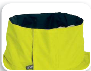
Cuello forrado lana polar