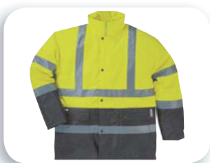
Forro desmontable del MULTIVIEW

Tejido poliéster. Forro Tafetán poliéster acolchado. Mangas tela 65% poliéster 35% algodón acolchado. Bandas retroreflectantes cosidas 3M Scotchlite™.