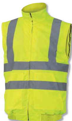
Cazadora sin mangas