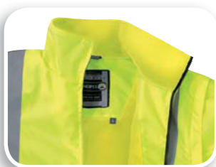
Forro lana polar

Tejido poliéster Oxford impregnado de poliuretano. Forro lana polar poliéster. Bandas retroreflectantes cosidas.