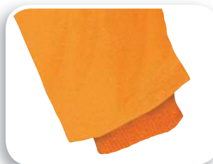
Puños interior tejido de punto