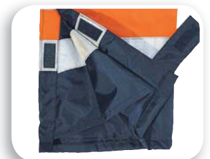
Bajo de piernas con fuelle de holgura