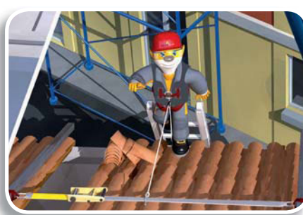
• ELARA17 (p.307) : vertical con cuerda 10 m + chaleco