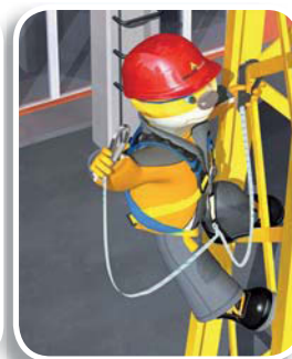
• ELARA28 (p.305) : andamios