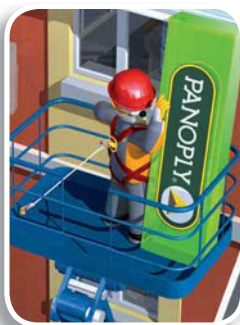
• ELARA13 (p.304) : protección en el trabajo

Encontrarán varios kits listos para el uso (ver pagina 304).