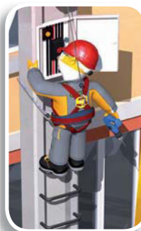
• ELARA32 (p.305) : mantenimiento y andamios