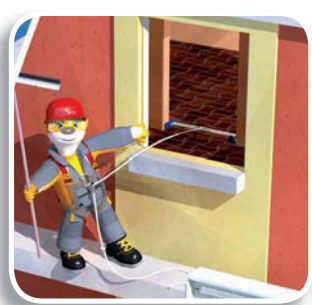
• ELARA15 (p.307) : vertical con cuerda 10 m