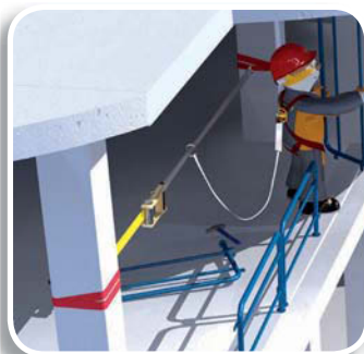
• ELARA16 (p.304) : base