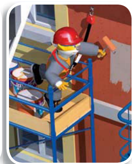
• ELARA14 (p.306) : vertical 2,5 m