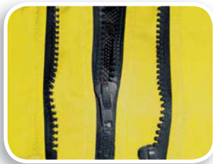
Talla ajustable por multi-cremallera