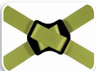
Hebilla de ajuste ergonómica lateral