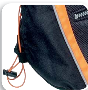
Talla ajustable por cordones laterales