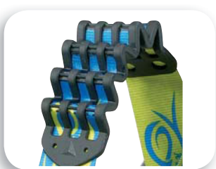
Cinchas extensibles "Riplight System"